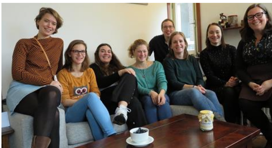
Ons teamtje van 5 december: Sinterklaasviering

Volg ons en onze leerlingen ook op social media, onze website of bereik ons per mail: